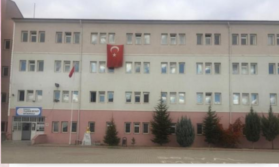
HÜSEYİN KÂHYA HIÇYILMAZ ORTAOKULU